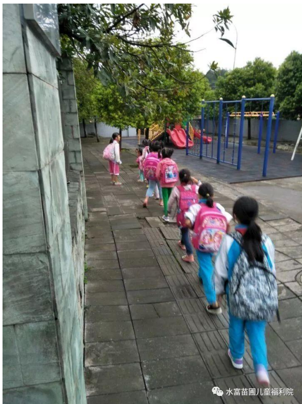
水富苗圃兒童福利院