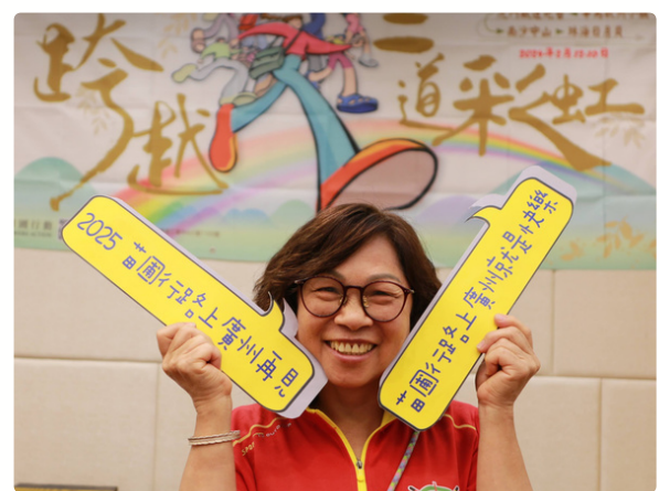
快樂就是行路上廣州